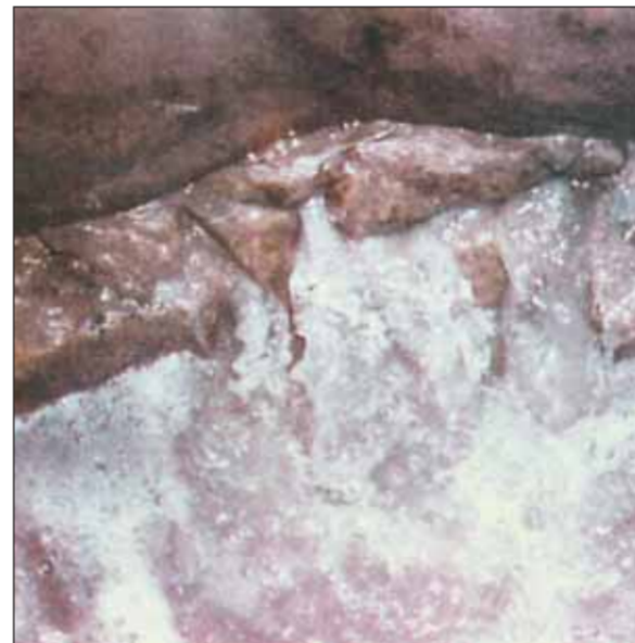
ماء زمزم وهو يخرج من مصدره.