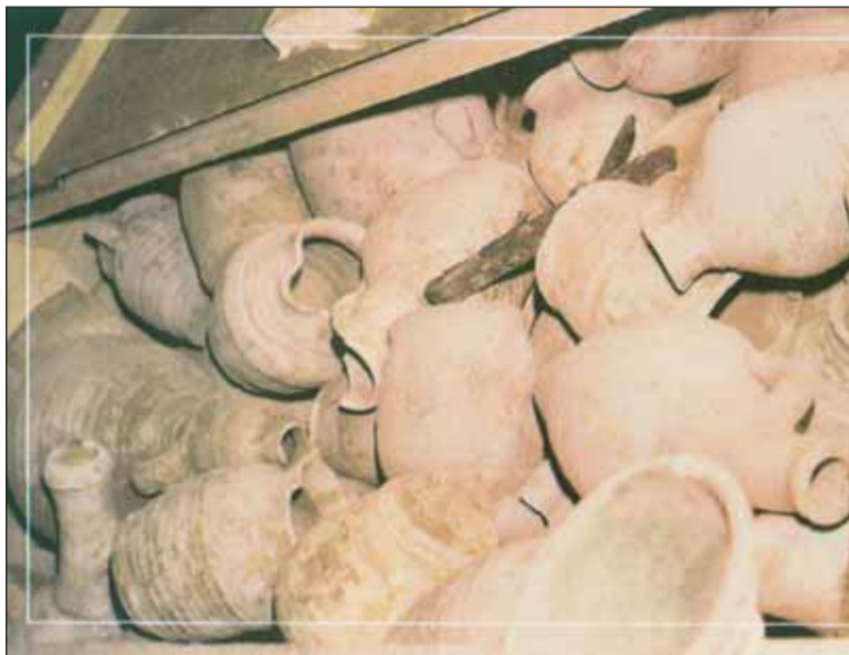
أوان فخارية وجدت داخل البئر.