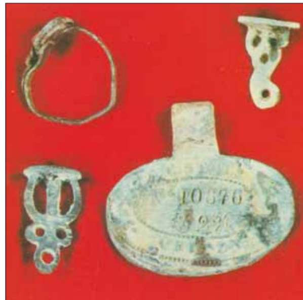
بعض الأحجار والعملات التي وجدت داخل البئر.