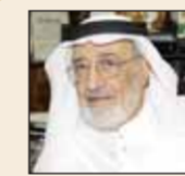
د. يحيى كوشك

تطرق رئيس اتحاد الاستشاريين في الدول الإسلامية الدكتور يحيى كوشك إلى قصة زميل له أتى إليه بقوله: «امره في مصطلح بمسمى «الصوم بالماء»، هذا الماء الطبيعي، فكيف بماء زمزم. ولعل بعضنا قد سمع عن قصة الصحابي الجليل أبي ذر الغفاري رضي الله عنه، الذي استخدم «الصوم بالماء» قبل ما يزيد عن ١٤ قرنا، قبل أطباء العصر الحالي، حين قال عن نفسه حينما اقتصر على شرب ماء زمزم ٣٠ يوما: «سمنت حتى تكسر عكن بطني، ولا أجد على كبدي سخفة